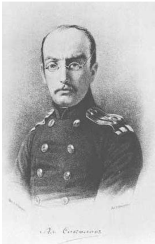
Олександр Петрович Соколов (1816–1858 рр.), перший дослідник Чорноморського архіву

«Не без сожалѣнія оставляя этотъ прекрасный край – въ которомъ еще не успѣлъ видѣть всего хорошаго – и его интересные архивы, которые еще не вполне исчерпаны» О.П. Соколов поїхав до Москви, а потім Санкт-Петербурга, де ще встиг написати кілька праць, у т. ч. уклав двотомну першу морську бібліографію «Русская морская библиотека» та «Летопись крушений и пожаров судов русского флота», перед тим як помер 1858 р. у віці 42 років.