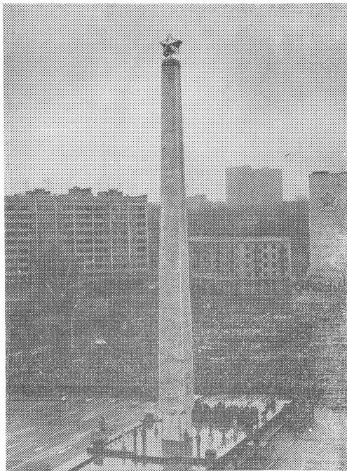
Урочисте відкриття обеліску міста-героя на площі Перемоги у м. Києві, 8 травня 1982 р.