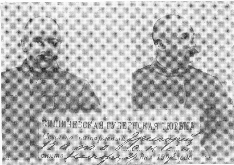
Г. І. Котовський. Тюремне фото. (ф. 231, оп. 1, спр. 2100, арк. 333).

У 1910 р. Котовський був переведений з Миколаєва до Смоленської пересильної тюрми, а звідти висланий до Сибіру.