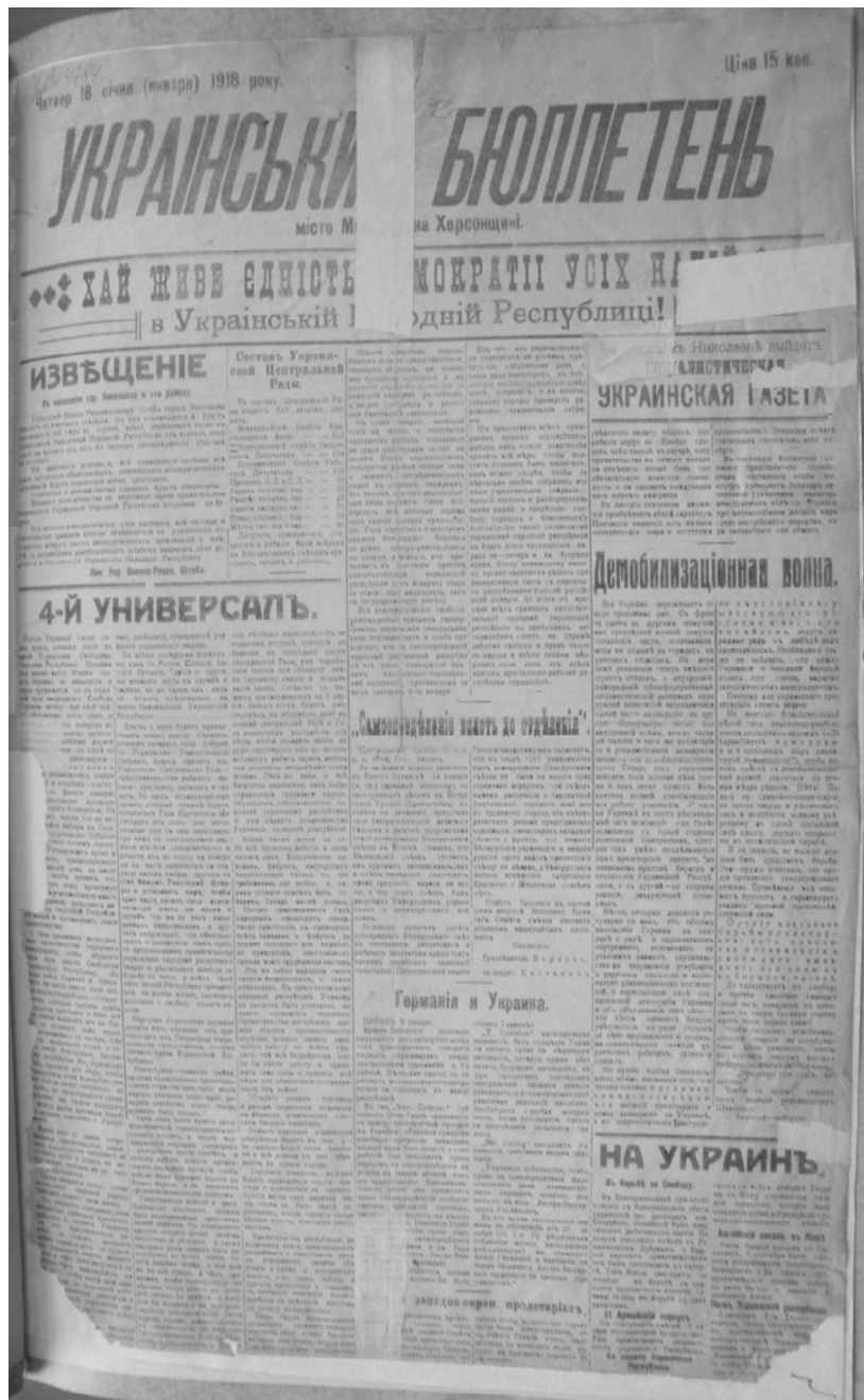
Рис. 2. Перше число офіційного видання Миколаївської ради об'єднаних українських організацій від 18 січня 1918 р. – «Український бюлетень». Виявлено автором у фондах Державної наукової архівної бібліотеки.

3 19 січня 1918 р. у Миколаєві вже друкувалася «Українська газета». Передовиця цієї газети під назвою «Наші завдання і тактика» доводила до всіх містян російською мовою позицію українських політичних сил: «Пройшовши історичні часи революції від початку до останнього етапу – 4-го Універсалу, який проголосив Україну незалежною Народною Республікою, українська демократія і в цей важкий момент зі своїх позицій не зійде – вона буде перемагати або гинути, але революційних позицій ворогам її не здавати» [43]. 19 січня 1918 р. Миколаївська рада об'єднаних українських організацій і Українська військова рада провели спільне засідання, на порядку денному якого були питання про 4-й Універсал,