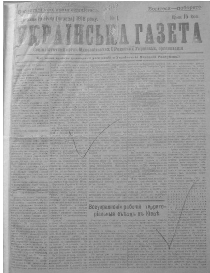
Рис. 3. Перше число офіційного видання Миколаївської ради об'єднаних українських організацій від 19 січня 1918 р. – «Українська газета». Виявлено автором у фондах Державної наукової архівної бібліотеки.